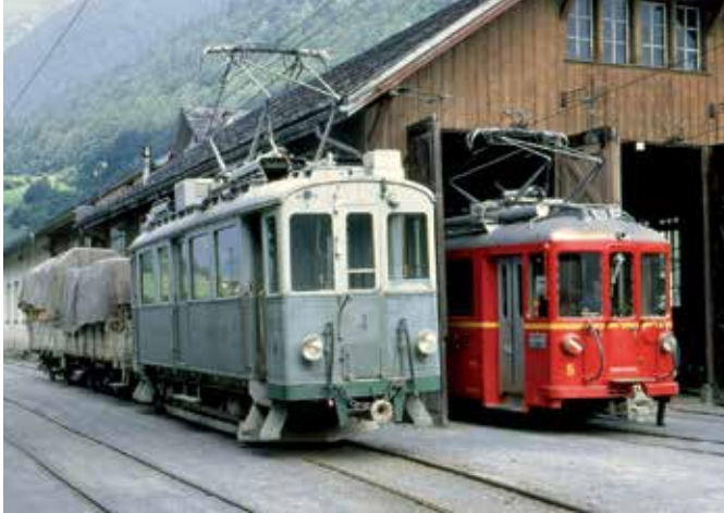
Betrieb in Engi Vorderdorf.

Wer mag sich noch an die kleine rote Bahn erinnern, die zuverlässig und den Gewalten der Natur trotzend von 1905 bis 1969 zwischen Schwanden und Elm verkehrte? Diese Bahn hat massgeblich zur wirtschaftlichen Entwicklung des Sernftals beigetragen. Sie lieferte den Textilbetrieben das Rohmaterial und holte die Endprodukte wieder ab, sie bediente verschiedene Steinbrüche und brachte die Talbewohner in die grosse weite Welt hinaus und manchen Touristen in die eindruckliche Berglandschaft hinein.