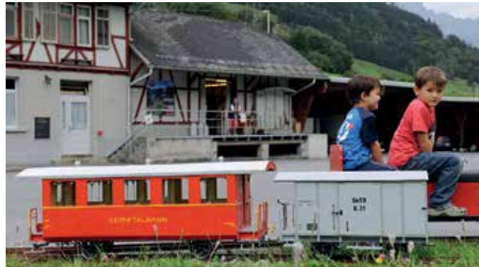
Gartenbahn vor dem SeTB-Museum in Engi Vorderdorf.

Öffentlicher Verkehr: SBB bis Schwanden GL, Busanschluss nach Engi Vorderdorf. Auto: Autobahn A3, Ausfahrt Niederurnen > Glarus > Schwanden > Engi Vorderdorf (Gratis-Parkplatz beim Museum).