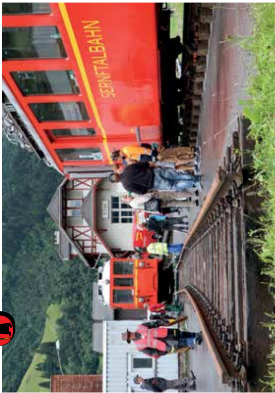
Ankunft des Triebwagens Nr. 5 in Elm am 25. Juli 2017.