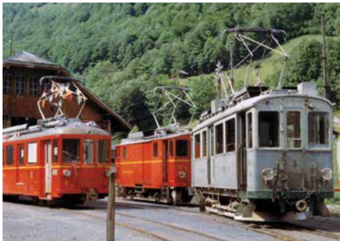
BDe 4/4 5, Xe 2/2 22 und CFe 2/2 4 in Engi Vorderdorf

Wer mag sich noch an die kleine rote Bahn erinnern, die zuverlässig und den Gewalten der Natur trotzend von 1905 bis 1969 zwischen Schwanden und Elm verkehrte? Diese Bahn hat massgeblich zur wirtschaftlichen Entwicklung des Sernftals beigetragen. Sie lieferte den Textilbetrieben das Rohmaterial und holte die Endprodukte wieder ab, sie bediente verschiedene Steinbrüche und brachte die Talbewohner in die grosse weite Welt hinaus und manchen Touristen in die eindruckliche Berglandschaft hinein.