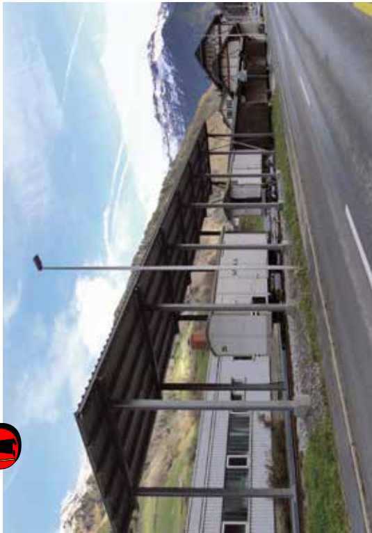
Die Güterwagen K 35 und K 36 unter der 2013 erbauten Museumsgeleisüberdachung.

Verein Sernftalbahnen Station Engi Vorderdorf Sernftalstrasse 17 CH-8765 Engi