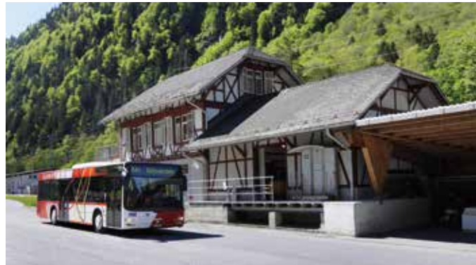
Sernftalbahnen Museum in Engi Vorderdorf, © Comet Photoshopping, Dieter Enz

Öffentlicher Verkehr: SBB bis Schwanden GL, Busanschluss nach Engi Vorderdorf. Auto: Autobahn A3, Ausfahrt Niederurnen > Glarus > Schwanden > Engi Vorderdorf (Gratis-Parkplatz beim Museum).